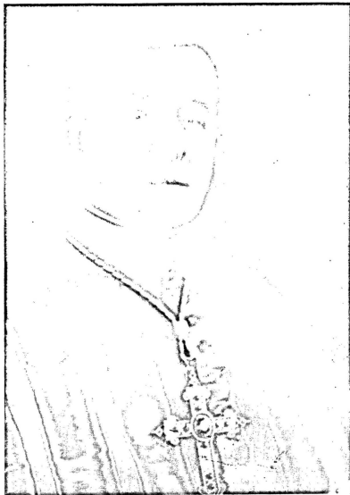
Son Eminence le Cardinal PIZZARDO, Préfet de la Sacrée Congrégation des Séminaires et Universités. Président du Bureau Central pour l'Action Catholique.

À la Section des Jeunes de l'Union des Ligues Fem. Cath. La Charité est la vraie garantie du succès dans nos oeuvres 14 Avril 1939 J. Gard. Pizzardo