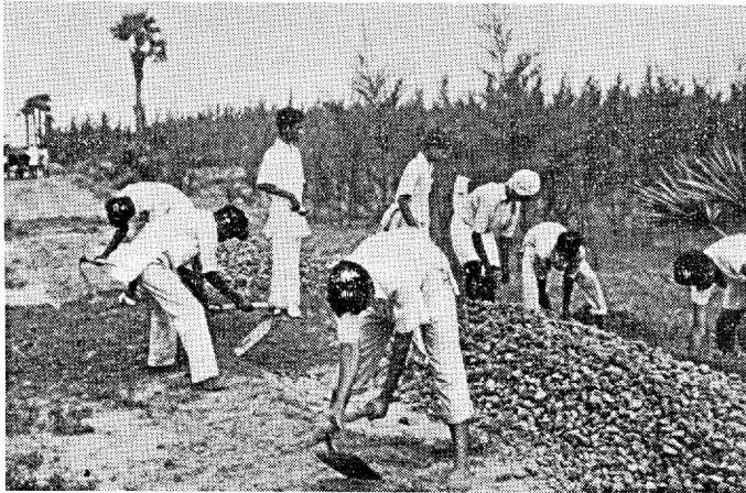
Camp de travail en Inde

d'équipes réalisant des projets concrets (camps de travail en Inde et en Nigéria, école du soir à Hong-Kong, etc.).