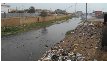
The lack of sanitation is the origin of numerous waterborne diseases.

For information about USAID WA-WASH, please visit our website at: http://www.globalwaters.net/projects/current-projects/wa-wash/