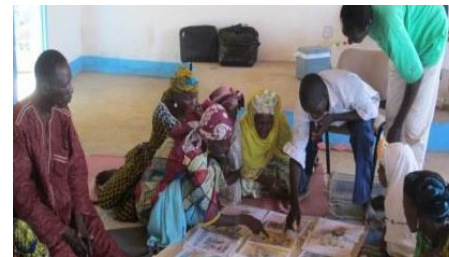
An awareness session on hygiene and sanitation in an intervention village of USAID WA-WASH program.