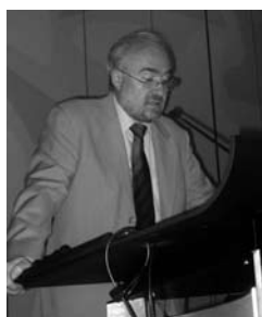
Sr. Michel Jarraud

Su alteza real, la princesa Zahra Aga Khan, en representación de la Red de Desarrollo Aga Khan, señaló que el terremoto del 2005 en Pakistán y al norte de la India la obligó a darse cuenta que era vital que las comunidades que viven en riesgo obtengan las herramientas y la tecnología, la educación y la capacitación necesarias para evaluar la seguridad de sus propios entornos y para que puedan adaptarlos con el fin de lograr los objetivos de la reducción del riesgo de desastres. Sin embargo, con frecuencia la reducción de desastres enfrenta barreras creadas por los propios seres humanos, tales como obstáculos administrativos, políticos, culturales y jurídicos que entorpecen el desarrollo y el cambio de los sistemas sociales y las estructurales en las zonas de alto riesgo.