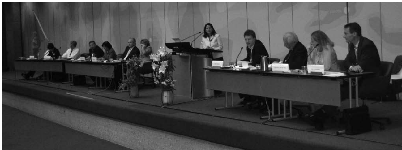
Mesa redonda con los donantes de la EIRD