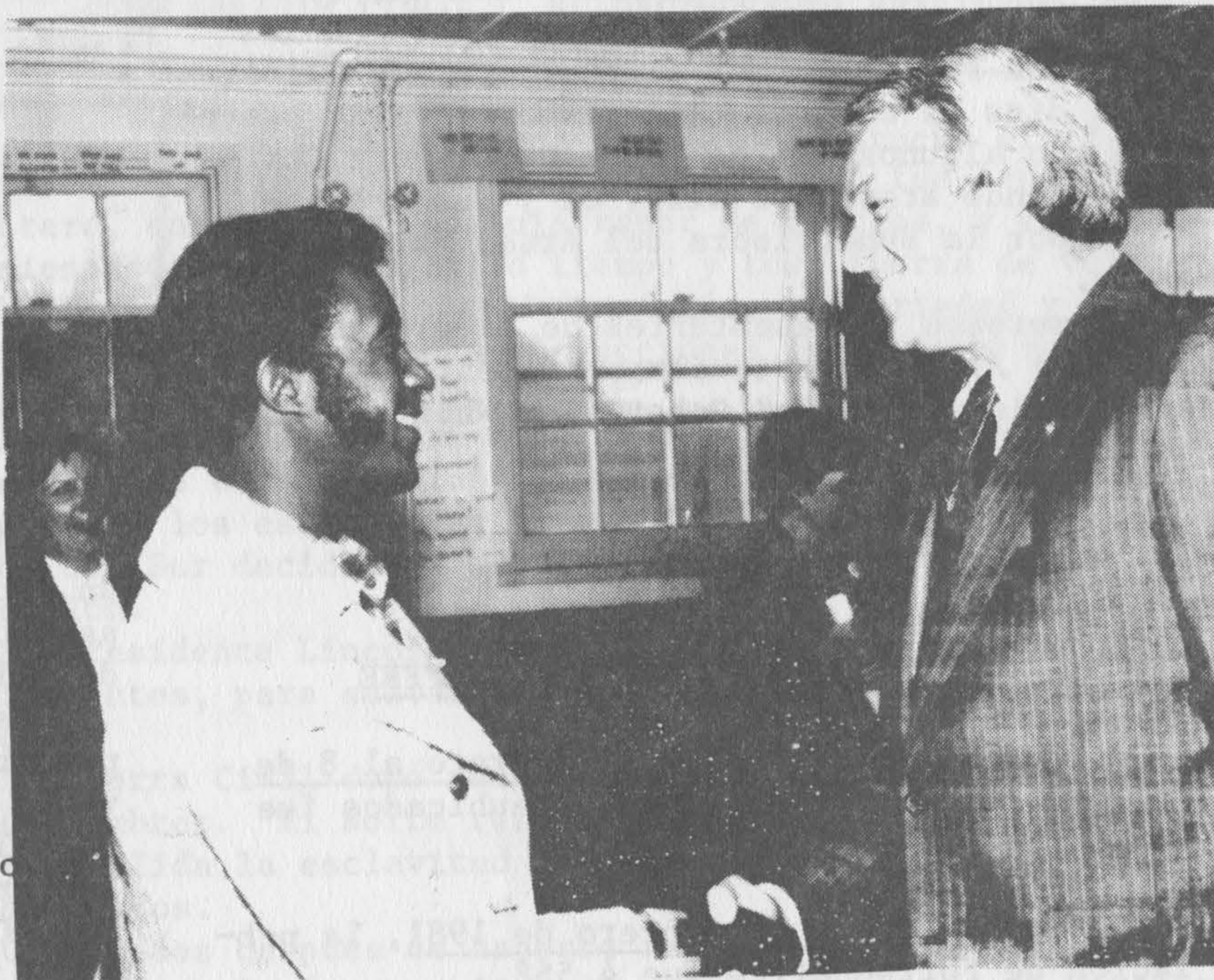
El Gobernador de Arkansas, Frank White, saluda a uno de los estudiantes de las clases de inglés.