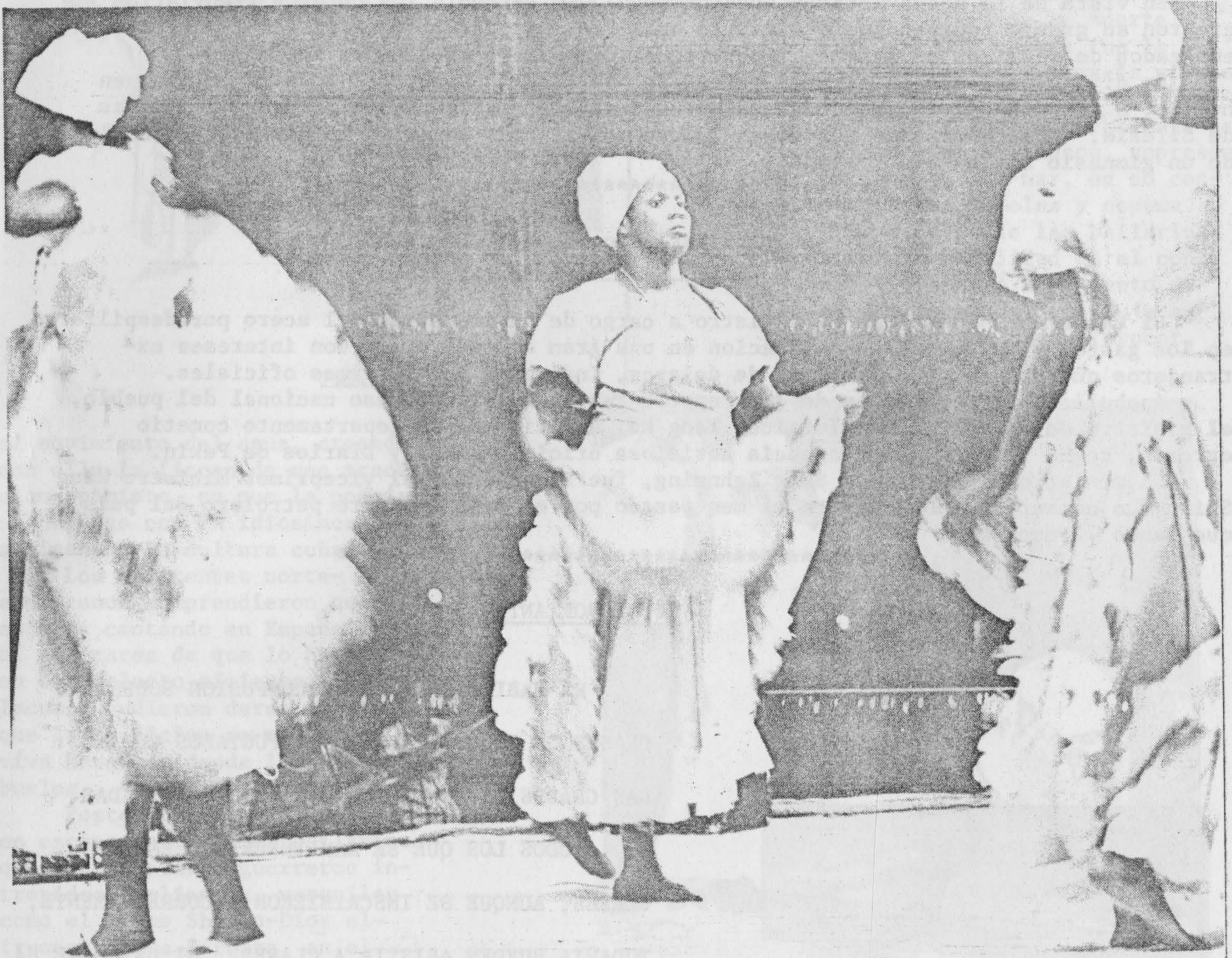
EL CONJUNTO FOLKLORICO DE FORT CHAFFEE.

El conjunto Folklorico de Fort Chaffee actuó en la noche de ayer en la calle 23 para los refugiados cubanos y para la PUBLIC BROADCASTING SERVICE. Los multicolores y algoricos trajes representativos de las distintas divinidades africanas sincretizadas con el santuario cristiano llenaron el escenario en el que los distintios "orishas" lucumies desarro llaban su dina mismo y habilidad, cautivando la atencion de cubanos y americanos por igual.