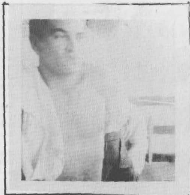
LAS FOTOS MUESTRAN EL MOMENTO EN QUE EL REFUGIADO ES ARRESTADO POR LA POLICIA FEDERAL