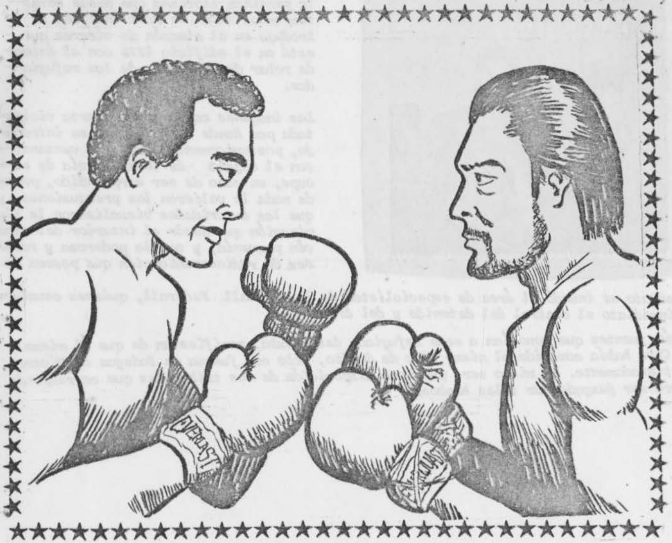
LEONARD VS. DURÁN

Fort Chaffee, Arkansas 21 de Junio, 1980 Numero 42