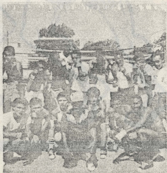
Grupo de Refugiados que componen el grupo de boxeadores que se entrena en F. Chaffee.