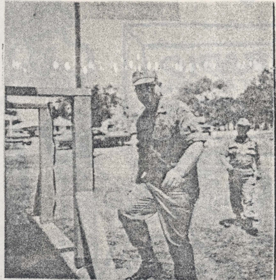
El Gral. de Brig. Drummond llegando a la Emisora KNJB.

A todos ellos nuestro reconocimiento por el trabajo que estamos seguros van a realizar por el bienestar de todos los refugiados cubanos en Fort Chaffee.