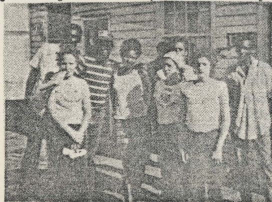
Grupo de Refugiados que esperan para ser atendidos en el Almacén de Avituallamiento de la Zona 1.

"Por lo demás, sólo me resta decir que estamos muy contentos por todos los beneficios y cuidados que se nos dispensan en Fort Chaffee desde nuestra llegada".